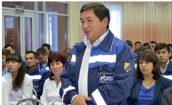
Ургалинцы задают вопросы генеральному директору