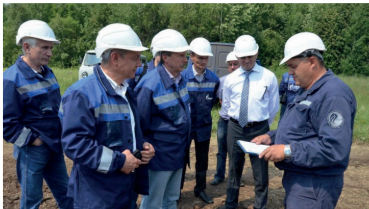
На участке ремонта