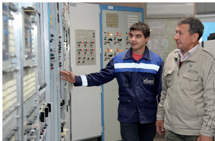
В помещении главного щита управления